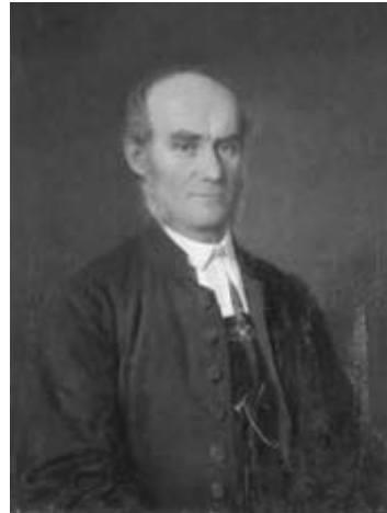
Le pasteur Uno Cygnaeus (1810-1888), père de l'école en Finlande

Le grand homme finlandais Uno Cygnaeus combinait en sa personnalité deux facettes : celle d'un pasteur et celle d'un scientifique curieux de tout. C'était un grand naturaliste qui avait fait le tour du monde, en bateau et en traversant l'Asie à cheval. Il a beaucoup insisté sur l'importance des sciences naturelles comme matières d'enseignement. D'autre part, une formation religieuse et morale devait aussi avoir sa place à l'école qu'il a fondée, et cette tradition continue encore aujourd'hui. Il y a un enseignement important de la tradition chrétienne à l'école en Finlande. Bien sûr, en même temps, c'est une école respectueuse de toutes les traditions religieuses. Par exemple, le foulard islamique n'y est pas interdit. Il convient d'insister sur les origines chrétiennes de l'école de la République finlandaise. Il faut comprendre que dans le paysage spirituel des campagnes finlandaises au XIX e siècle, quand la Nation finlandaise a pris forme, les figures du curé et de l'instituteur n'étaient pas antagonistes, comme en France. Au contraire, c'étaient des alliés et parfois ils étaient la même personne ; c'était le cas de Cygnaeus.